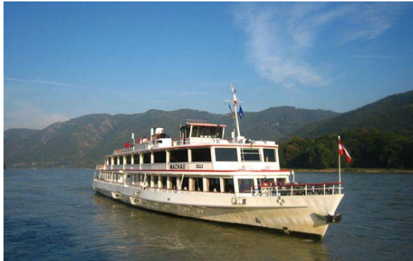
↑ MS Wachau