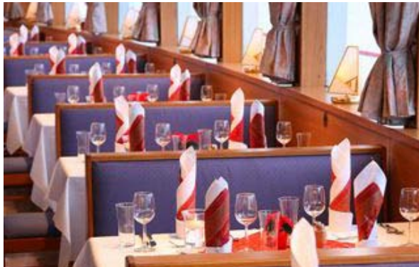
↑ MS Wachau – Hauptdeck, Bugsalon