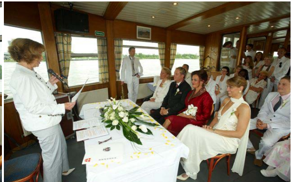
↑ MS Schlögen – Hauptdeck, Bugsalon