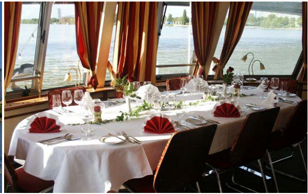
↑ MS Admiral Tegetthoff – Oberdeck, Bug