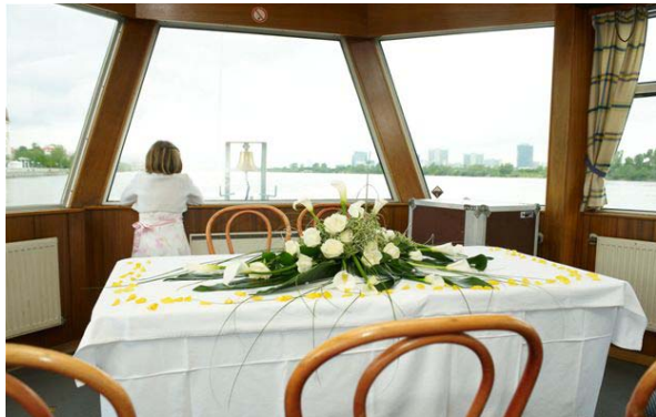
↑ MS Schlögen – Hauptdeck, Bugsalon