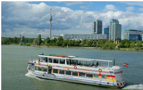
↑ MS Schlögen auf voller Fahrt durch Wien