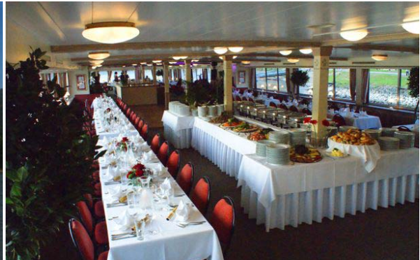
↑ MS Prinz Eugen - Oberdeck