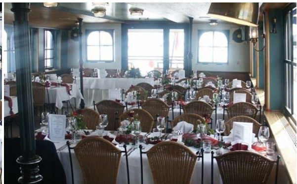
↑ MS Vindobona - Oberdeck