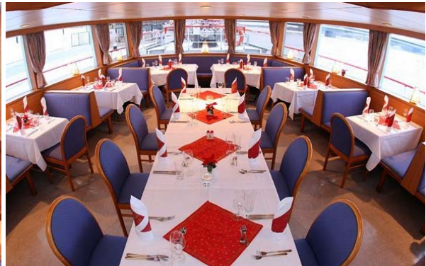
↑ MS Wachau – Hauptdeck, Bugsalon