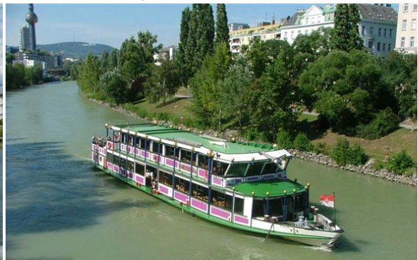
↑ MS Vindobona, das Hundertwasserschiff