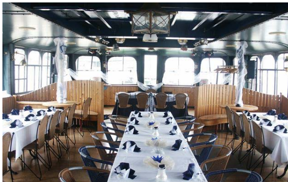
↑ MS Vindobona – Hauptdeck, Bug