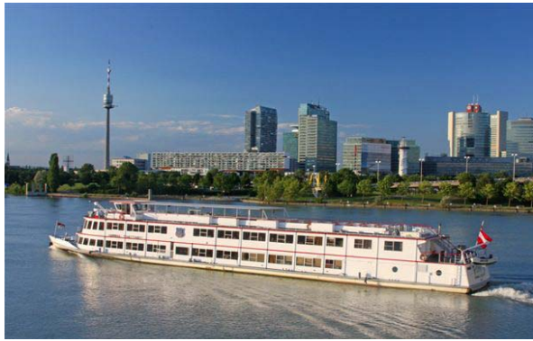
↑ MS Admiral Tegetthoff